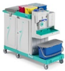
Magic System 800E